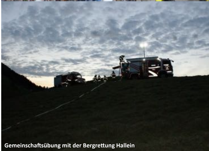
Gemeinschaftsübung mit der Bergrettung Hallein