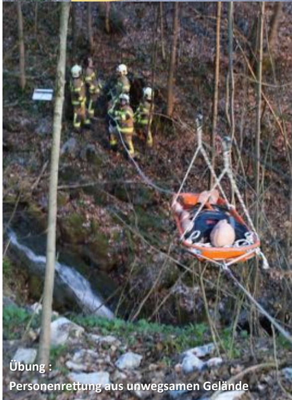
Übung : Personenrettung aus unwegsamem Gelände