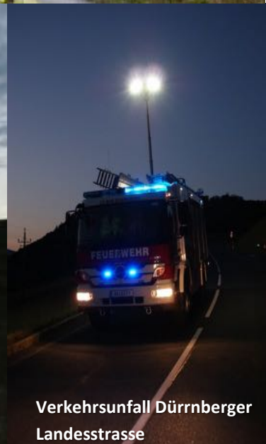
Verkehrsunfall Dürrnberger Landesstrasse