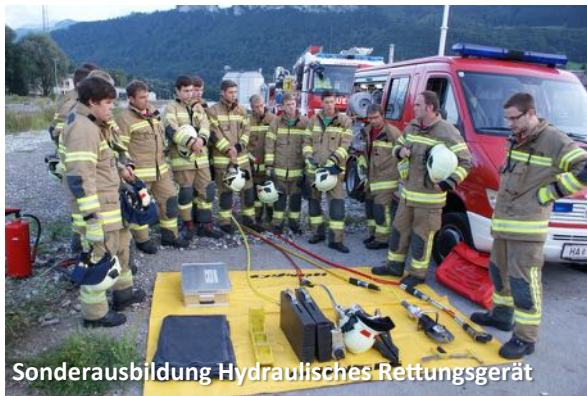
Sonderausbildung Hydraulisches Rettungsgerät