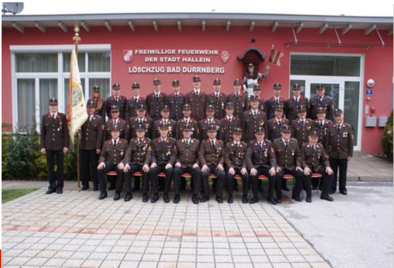
Die Mannschaft des Löschzug Bad Dürrnberg 2013

Ich wünsche Ihnen nun viel Freude beim Lesen dieser ersten Ausgabe und hoffe dass Ihnen unser Magazin gefällt.