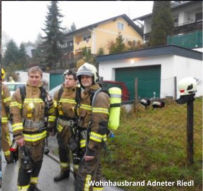
Wohnhausbrand Adneter Riedl