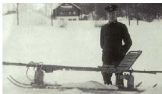
Der erste Feuerwehrrettungsschlitten