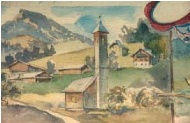
Alte Feuerwehrzeugstätte - errichtet 1923

Im Jahr 1922 gab es größere Auseinandersetzungen mit der ebenfalls hier ansässigen Salinenfeuerwehr. Die „Freiwilligen“ durften nur gegen jederzeitigen Widerruf die salineneigene Zeugstätte benutzen. Aus diesem Grund wurde mit dem Bau einer eigenen Zeugstätte begonnen, welche 1923 bezogen wurde. Der Standort befand sich an der Hellstraße. Die Gesamtkosten betrugen 10.070.646 Kronen.