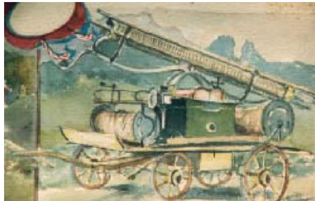
Der erste „Spritzenwagen“ - 1926